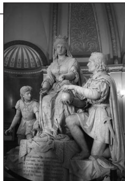
Estatua a Isabel la Católica que las autoridades de California han decidido retirar

Por lo tanto, concluye Viganò, “llega un momento en nuestras vidas en que, por disposición de la Providencia, nos enfrentamos a una opción decisiva para el futuro de la Iglesia y para nuestra salvación eterna. Me refiero a la opción entre comprender el error en que prácticamente todos hemos caído, casi siempre sin mala intención, y seguir mirando para el otro lado o justificándonos a nosotros mismos. También hemos cometido, entre otros, el error de considerar a nuestros interlocutores como personas que, a pesar de la diferencia de ideas y de fe, se han movido siempre por buenas intenciones y que estarían dispuestas a corregir sus errores si pudieran convertirse a nuestra Fe. Junto con numerosos Padres Conciliares, concebimos el ecumenismo como un proceso, como una invitación que