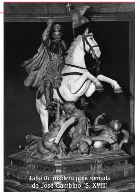
Talla de madera policromada de José Gambino (S. XVIII)

Solo en raras ocasiones las demandas de salud física entran en conflicto con las demandas del bienestar espiritual. Pero tal conflicto ha surgido en estas últimas semanas. Diferentes pastores han resuelto ese conflicto de diferentes maneras, y no voy a cuestionar sus juicios. Pero demasiados pastores, en lugar de tomar sus propias de-