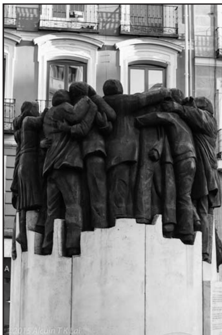
Monumento a los abogados asesinados en la Matanza de Atocha de 1977, situado en la plaza de Antón Martín de Madrid.

Todo esto se olvida y todo se disculpa en la izquierda. Cualquier virtud real o supuesta sirve para exculpar o atenuar sus gravísimos pecados. Los abogados asesinados eran miembros de las ilegales Comisiones Obreras, sindicato comunista implicado pocos años antes en el brutal atentado terrorista de la cafetería