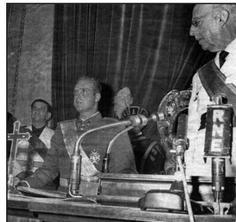
El 23 de Julio de 1969 el Príncipe Juan Carlos juró lealtad al Jefe del Estado, Francisco Franco y a las Leyes Fundamentales del Reino.