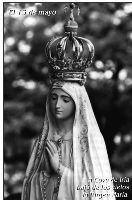
a Cova de Iria bajo de los cielos la Virgen María.