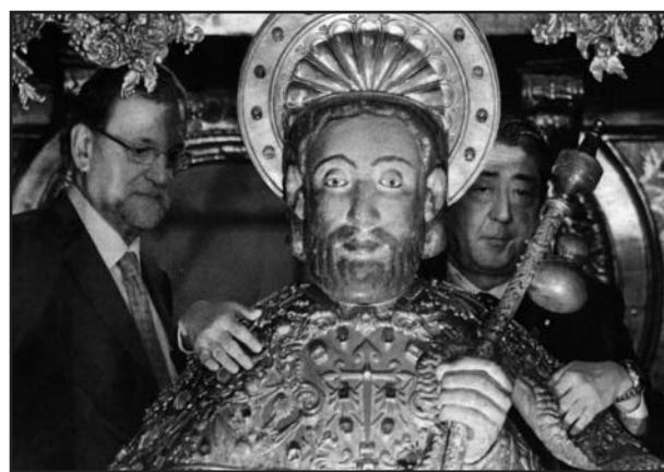
En la foto, El primer ministro japonés, Shinzo Abe, abraza la imagen del Apóstol Santiago en la catedral en presencia de Mariano Rajoy.

El laico aconfesional Mariano Rajoy guía al primer ministro japonés, Shinzo Abe , en su visita a Santiago de Compostela a diversos puntos de la capital gallega, como el Monte do Gozo, en donde han peregrinado por un pequeño tramo de la Ruta Jacobea. Ya dentro del templo han observado el espectacular rito del Botafumeiro y han aprovechado para realizar el tradicional abrazo al Apóstol Santiago mientras se celebraba la ‘Misa del Peregrino’. La delegación japonesa en el Camino de Santiago recuerda que los nipones tienen una ruta similar de peregrinaje por sus templos budistas, el Camino Kumano. Lo religioso convertido en cultura y folklore .