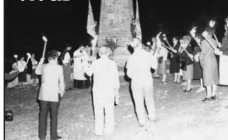
Monte San Cristóbal (Artica-Pamplona)

Todos los años desde 1987 en su fiesta, Viernes de la semana siguiente al Corpus Christi